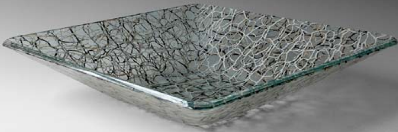
Ulrike Umlauf-Orron: Schalenobjekt, 2009, Glas, Fusingtechnik, 37 x 37 x 9 cm