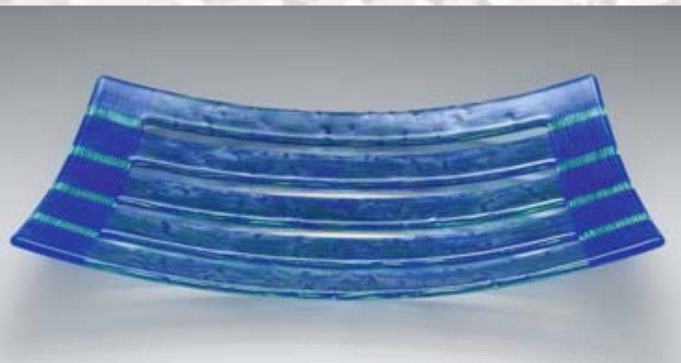
Ulrike Umlauf-Orron: Schalenobjekt, 2004, Glas, Fusingtechnik, 41 x 30 x 6 cm, Foto: Ulrike Umlauf-Orron

wieder neu und verleitet dazu, weiter zu forschen, was an komplexen Strukturen und Überlagerungen noch möglich ist. Dass die Arbeit am Glas selbst wenig romantisch ist, sondern Ausdauer und Stehvermögen erfordert, tut dabei dem Zauber keinen Abbruch, der sie immer wieder erfasst, wenn sie den Ofen, ihre „Wunderküte“ öffnet und die Ergebnisse mitsamt ihren Überraschungen begutachtet.