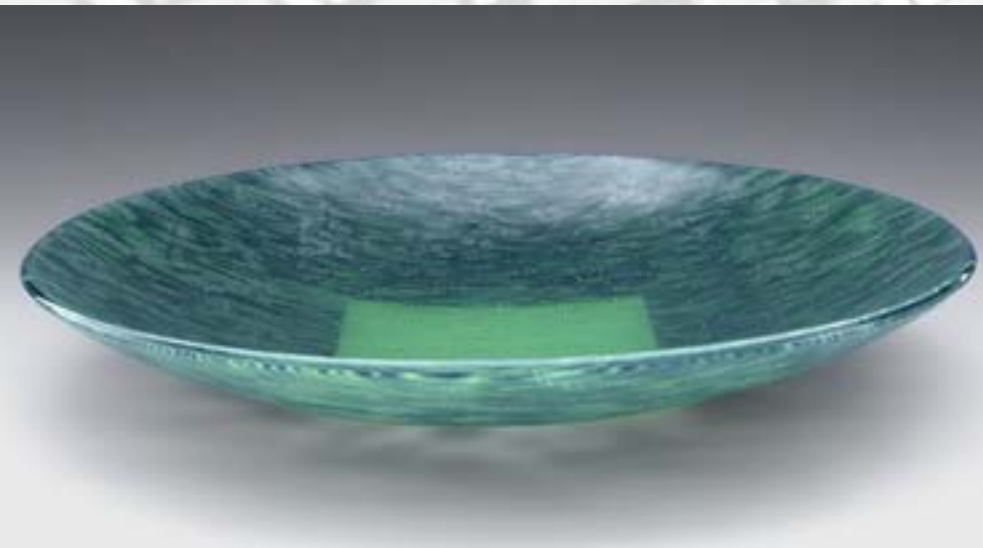
Ulrike Umlauf-Orron: Schalenobjekt, 2001, Glas, Fusingtechnik, 44 x 44 x 7 cm, Foto: Ulrike Umlauf-Orron