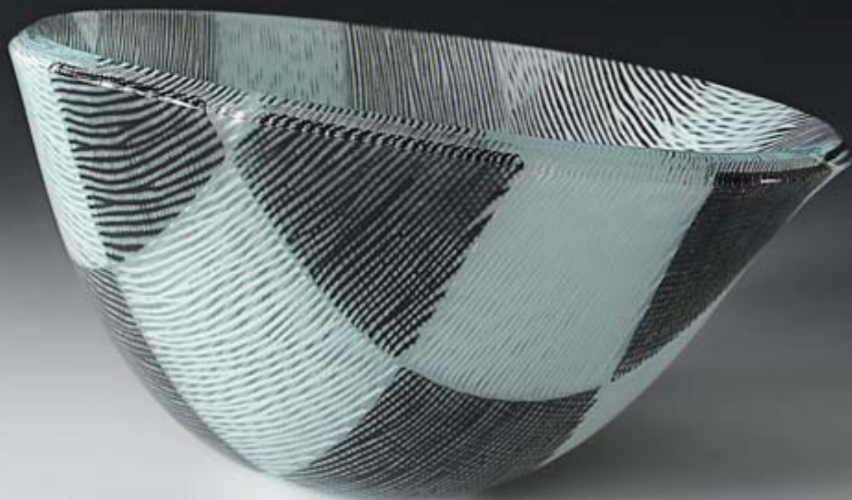
Ulrike Umlauf-Orron: Schalenobjekt, 2009, Glas, Fusingtechnik, 29 x 28 x 16 cm, Foto: Ulrike Umlauf-Orron