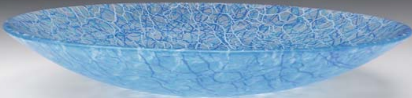
Ulrike Umlauf-Orrom: Schalenobjekt, 2009, Glas, Fusingtechnik, 46 x 46 x 8 cm, Foto: Ulrike Umlauf-Orrom

kanischen Pilchuck Glass School – Sandguss bei dem Glaskünstler Bertil Vallien – hat dazu vermutlich einiges beigetragen. Seit fünfundzwanzig Jahren arbeitet Ulrike Umlauf-Orrom mit Glas in verschiedenen Techniken, derzeit in einer Variante des Fusings, die sie für ihre besonderen Anlie-