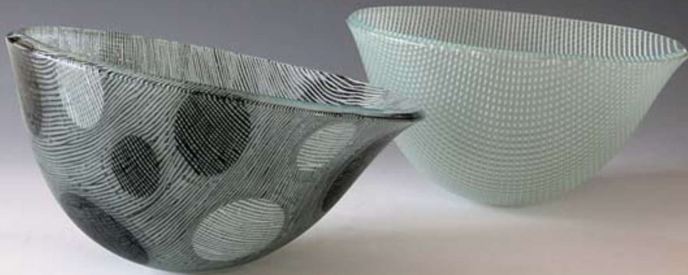
Ulrike Umlauf-Orron: links: Schalenobjekt, 2009, Glas, Fusingtechnik, 29 x 28 x 17 cm, rechts: Schalenobjekt, 2008, Glas, Fusingtechnik, 29 x 29 x 17 cm