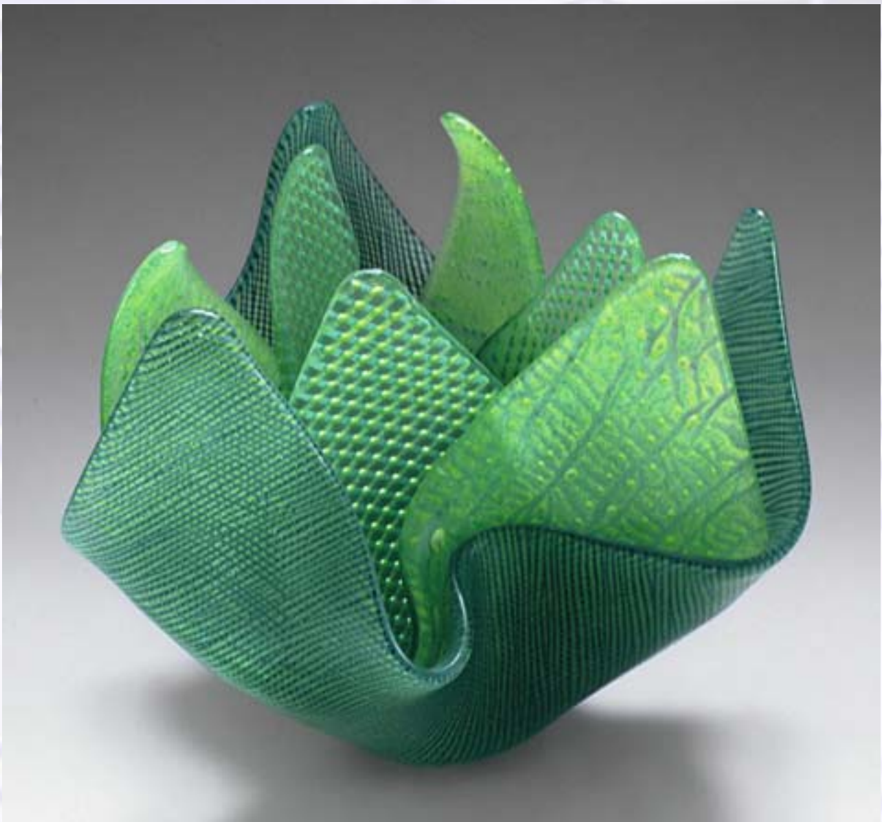
Ulrike Umlauf-Orrom: Knospe, 2005, 24 x 24 x 21 cm