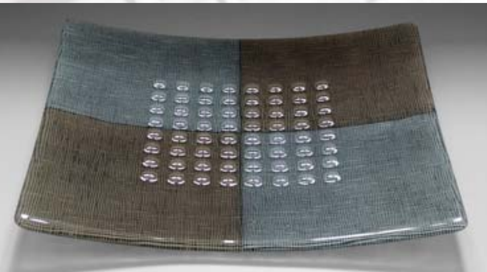
Ulrike Umlauf-Orron: Schalenobjekt, 2006, Glas, Fusingtechnik, 44 x 44 x 4 cm